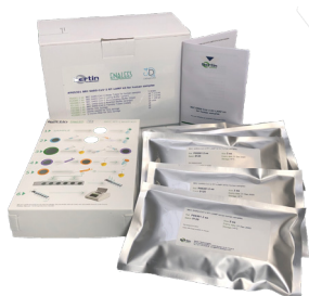
Kit de 10 tests